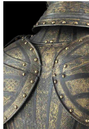
Detail eines bedeutenden norditalienischen Feldharnisches, geätzt, gebläut und vergoldet - der Werkstatt des Pompeo della Chiesa zugeschrieben, um 1580-1600.