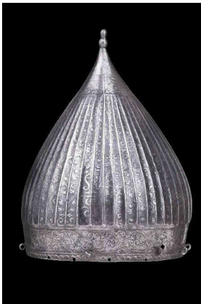
Sehr seltene geätzte Çiçak im türkischen Stil, Nürnberg 1560 -1580.