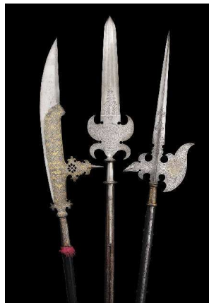
Reich verzierte Zeremonialgleve (1605 – 1610) der Palastwache des Kardinals und Begründers der Kunstsammlung Borghese, Scipione Caffarelli-Borghese (1577 – 1633).