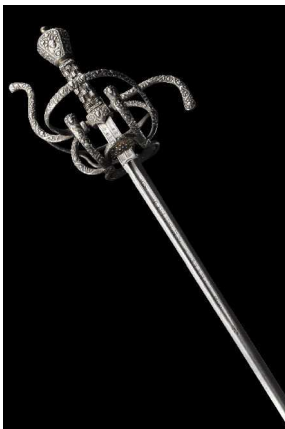
Geschnittener eiserner Rapier mit Spangengefäß und feinen Silbereinlagen, 16. Jahrhundert.