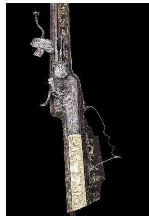
Radschlossgewehr mit feinen Einlagen in Horn und Elfenbein, deutsch oder böhmisch, datiert 1667.